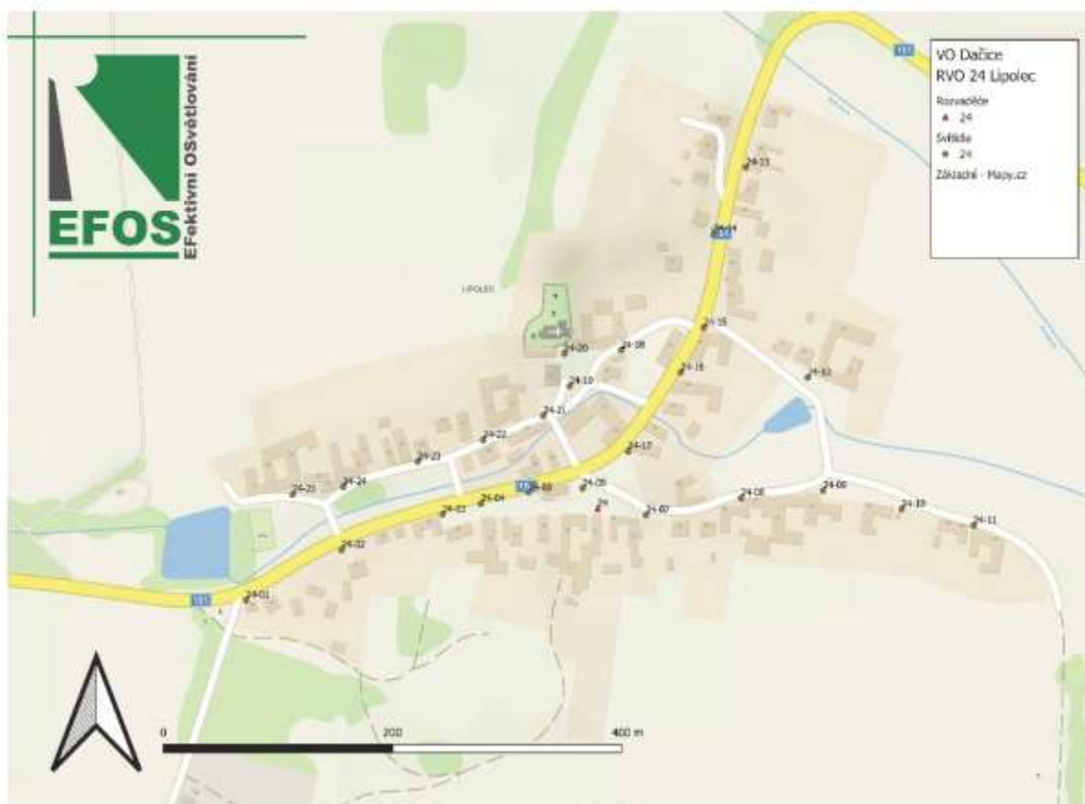
Situace SM: RVO 24

Účastník podpisem níže stvrzuje, že se seznámil s touto přílohou.